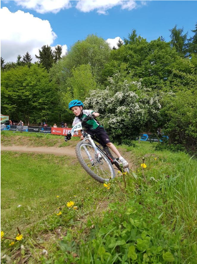
Bild: „2017_05_24 Fahrrad“ – Viel Programm rund ums Fahrrad wird am Samstag in Waldschaff geboten.