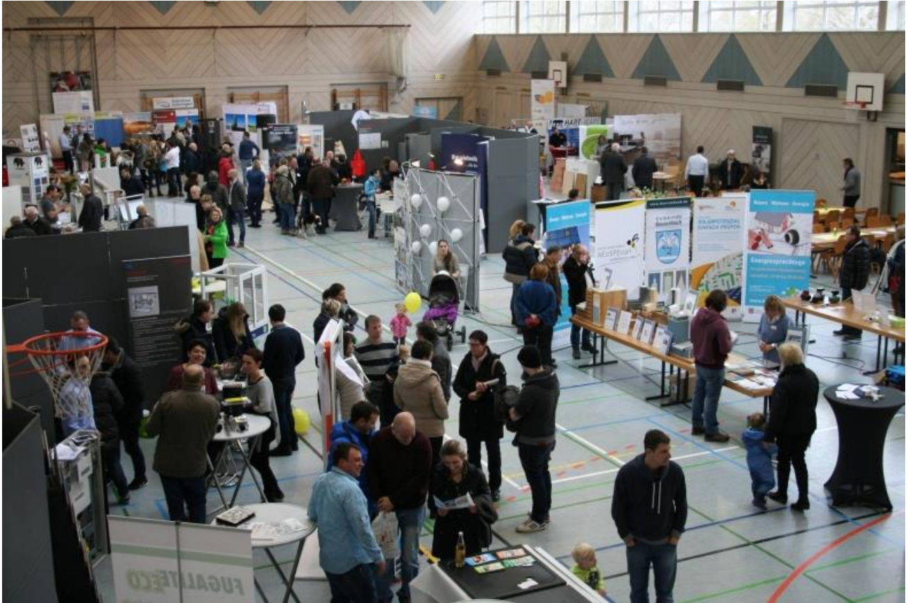
Bild von der Bauherrenmesse in Bessenbach im Januar 2017.