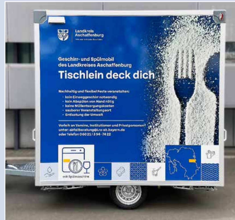
Das Geschirr- und Spülmobil des Landkreises Aschaffenburg

Bei Kündigung des Mietvertrages ohne Nutzung des Geschirrmobils ist der Vermieter berechtigt, dieses nach Möglichkeit weiter zu vermieten. Ist dies nicht möglich, werden 50 Prozent des Mietpreises fällig.