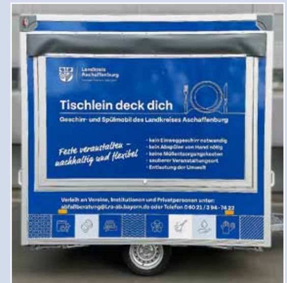
Mit aufklappbarer Theke

Freiwillige Feuerwehr Schöllkrippen Aschaffener Straße 68 63825 Schöllkrippen